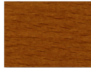
2216 Teak dunkel