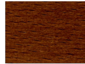
2217 Nussbaum braun