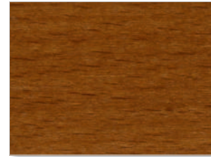
2208 Nussbaum mittel