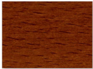
2211 Eiche dunkel