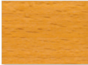
2202 Kirschbaum hell