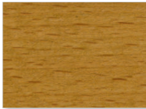
2212 Nussbaum hell