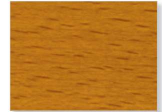
2210 Eiche mittel